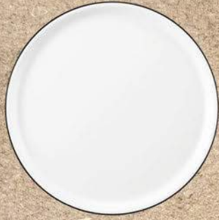
Pizzateller 30 cm Pizza plate 11.8 inch