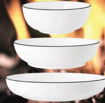
Foodbowl 28 / 25 / 20 cm Foodbowl 11.0 / 9.8 / 7.9 inch