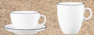
Espressoobertasse 1132 0,09 ltr. Espresso cup 3.0 oz. Espresso untertasse 1132 12 cm Saucer 4.7 inch