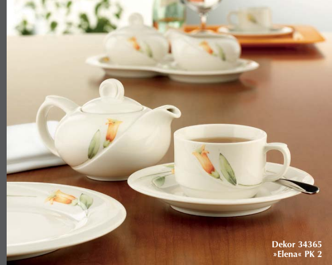
Dekor 34365 »Elena« PK 2