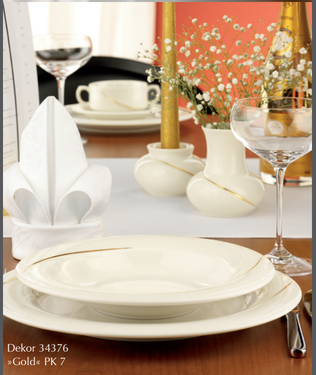
Dekor 34376 »Gold« PK 7