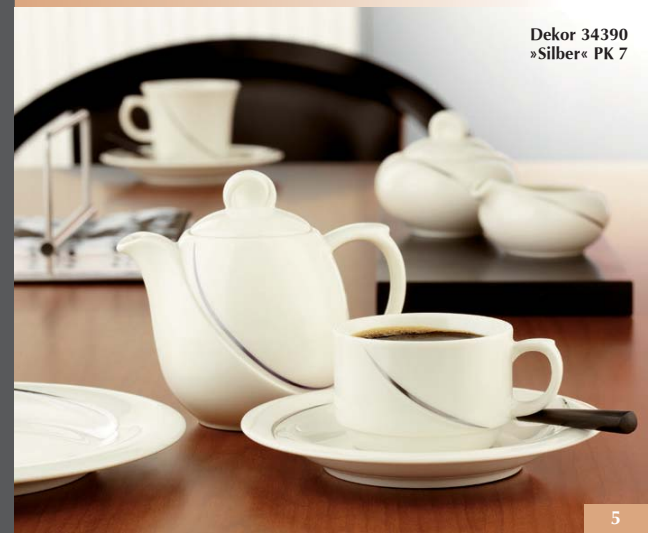
Dekor 34390 »Silber« PK 7