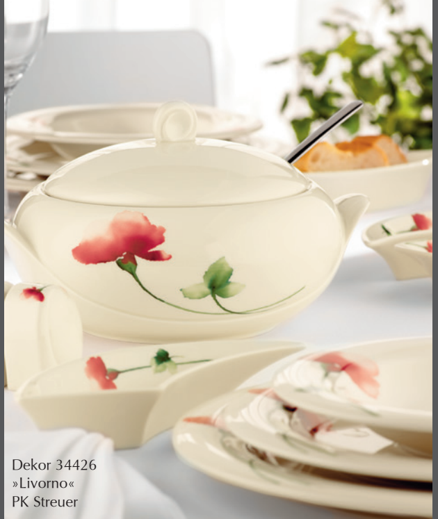
Dekor 34426 »Livorno« PK Streuer