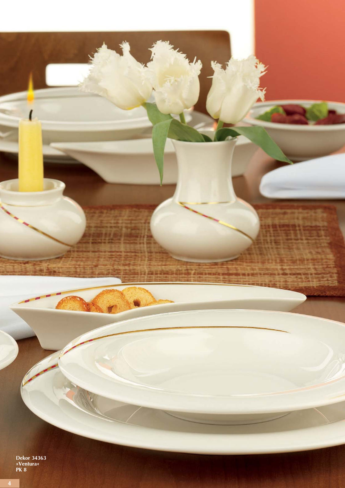
Dekor 34363 »Ventura« PK 8

Das Besondere an LUXOR ist das weich geschwungene Relief und der sehr elegante, feinglänzende Cremeton, ein unverwechselbarer Auftritt von hohem Wiedererkennungswert ist garantiert.