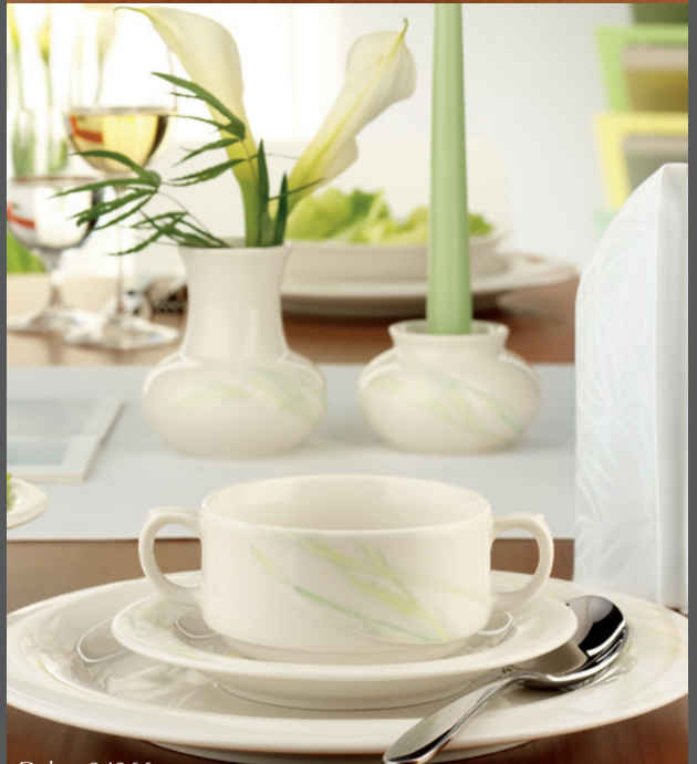
Dekor 34366 »Aradena« PK Streuer