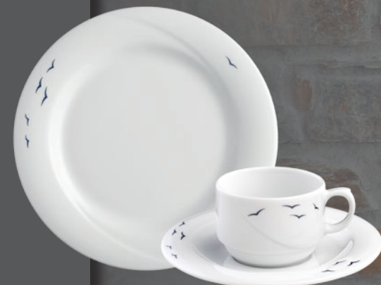
33374 (PK Streuer)