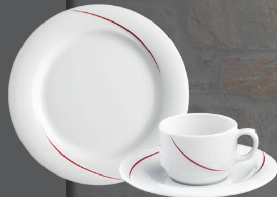
34622 bordeaux (PK 2)