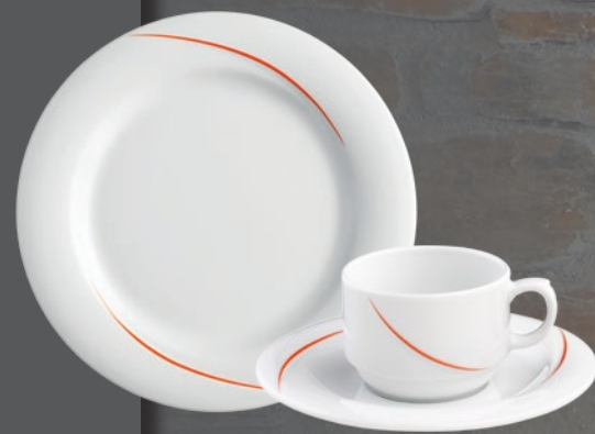
34465 orange (PK 2)