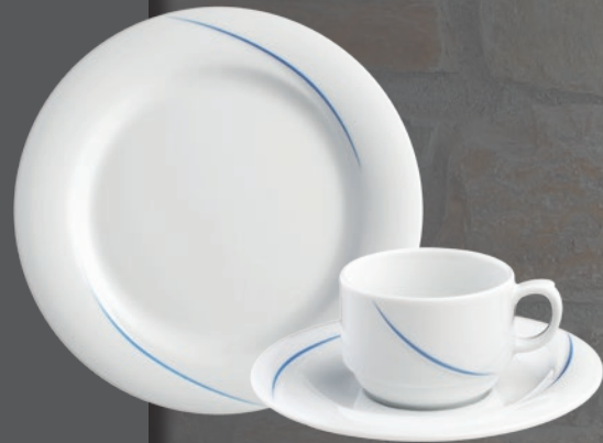
56253 blau (PK 2)