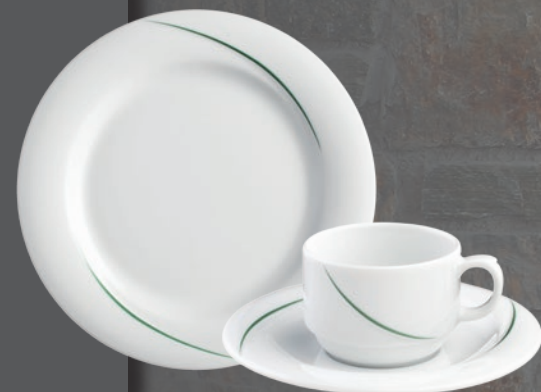
56255 grün (PK 2)